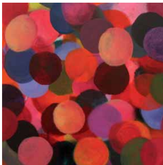
o. T. Ausschnitt · Acryl auf Leinwand · 90 x 120 cm · 2005

1994 „Große Kunst Ausstellung NRW“, Kunstpalastr, Düsseldorf. 1995 Goethe Institut und OXY Galerie, Osaka/Japan 1997 Künstlerhaus Dortmund 1998 Internationales Kunstsymposion, Donji Milanovac/Serbien 1999 Städtische Museum Schloss Rheydt, Mönchengladbach 2002 „Ambivalenzen“, Frauenmuseum Bonn, Galerie Münsterland e.V. 2007 „24|7“, Galerie arteversum, Düsseldorf