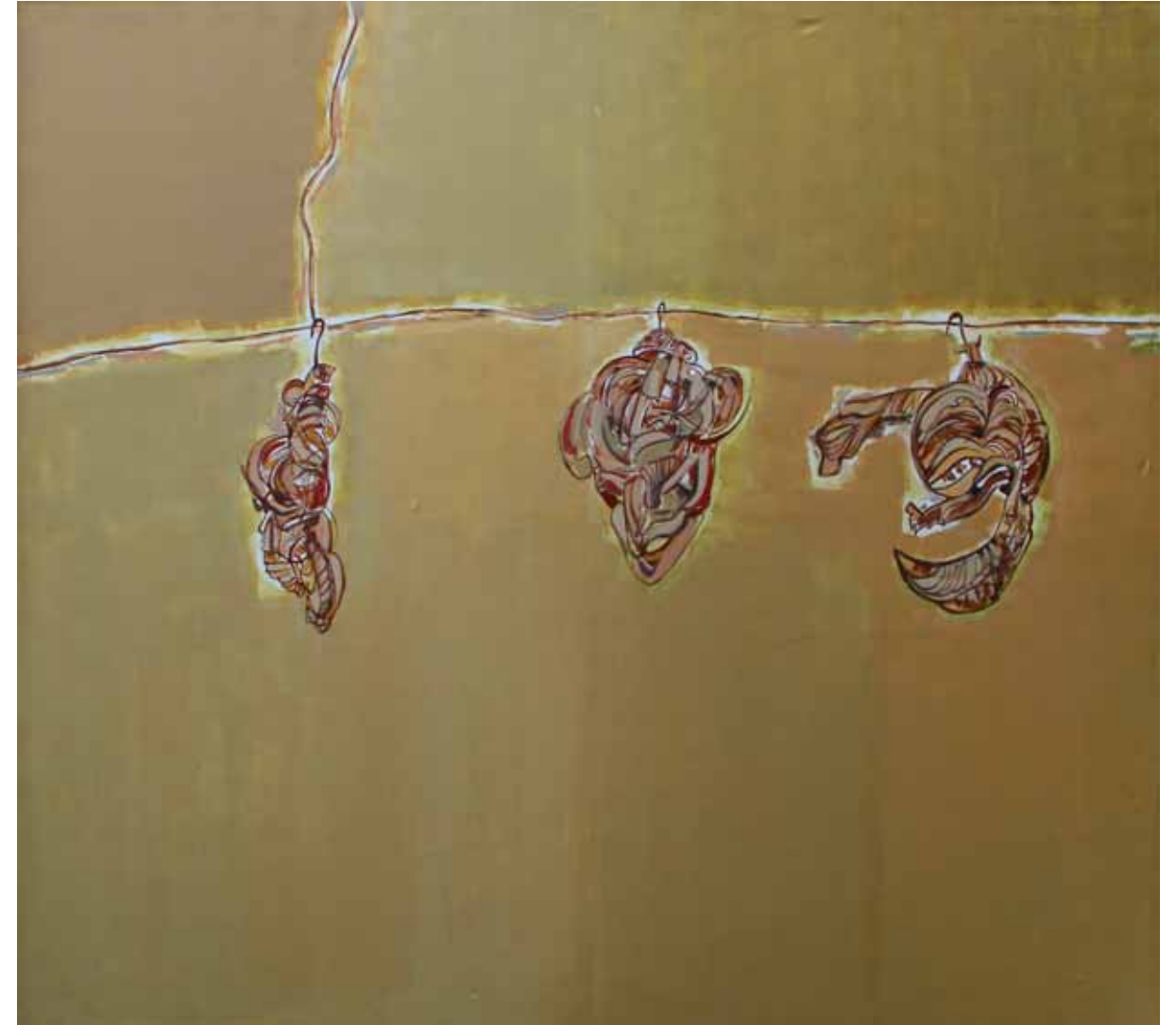
le pendu-suspendu Acryl auf Leinwand · 200 x 200 cm · 2009