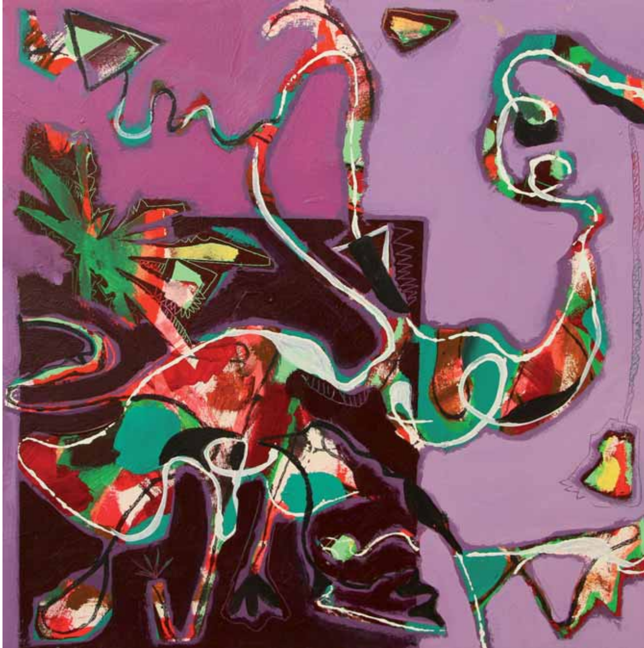
le "je" en jeux (Das Ich im Spiel) · Acryl auf Leinwand · 70 x 70 cm · 2011