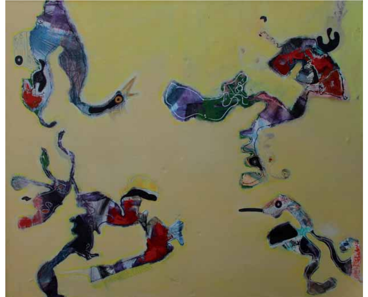
ma ligne maligne

3 Ausschnitte · Acryl auf Leinwand · 200 x 200 cm · 2009