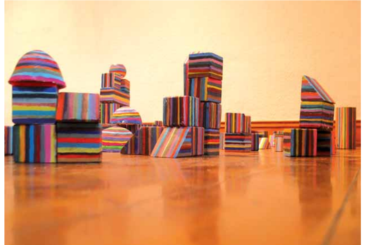
Bau Klötze Acryl auf Holz - 2000