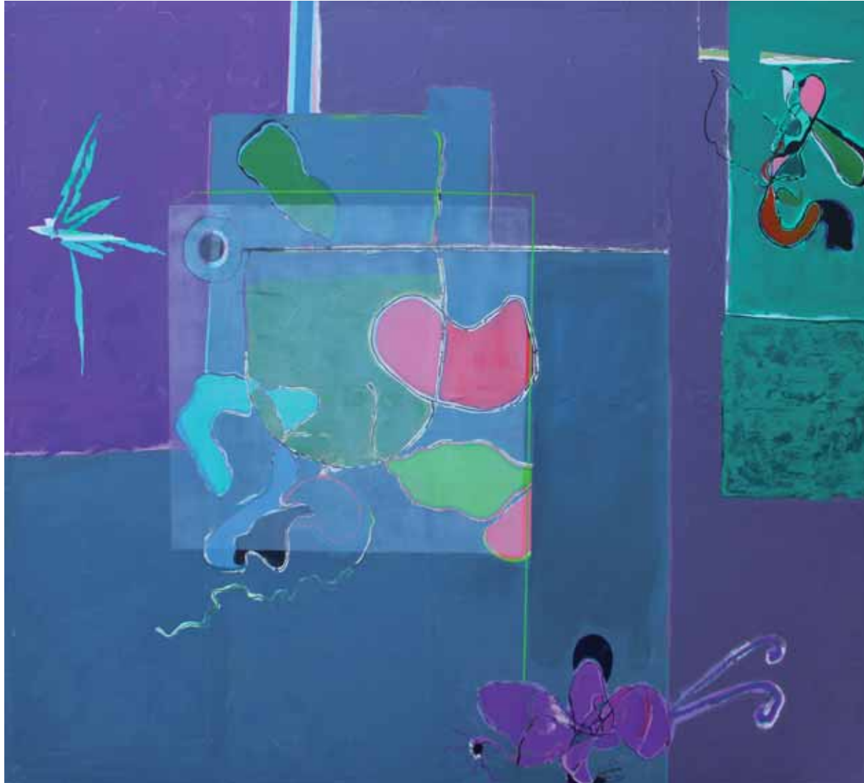
trans-positions [Trans-positonen] · Acryl auf Leinwand · 200 x 200 cm · 2009