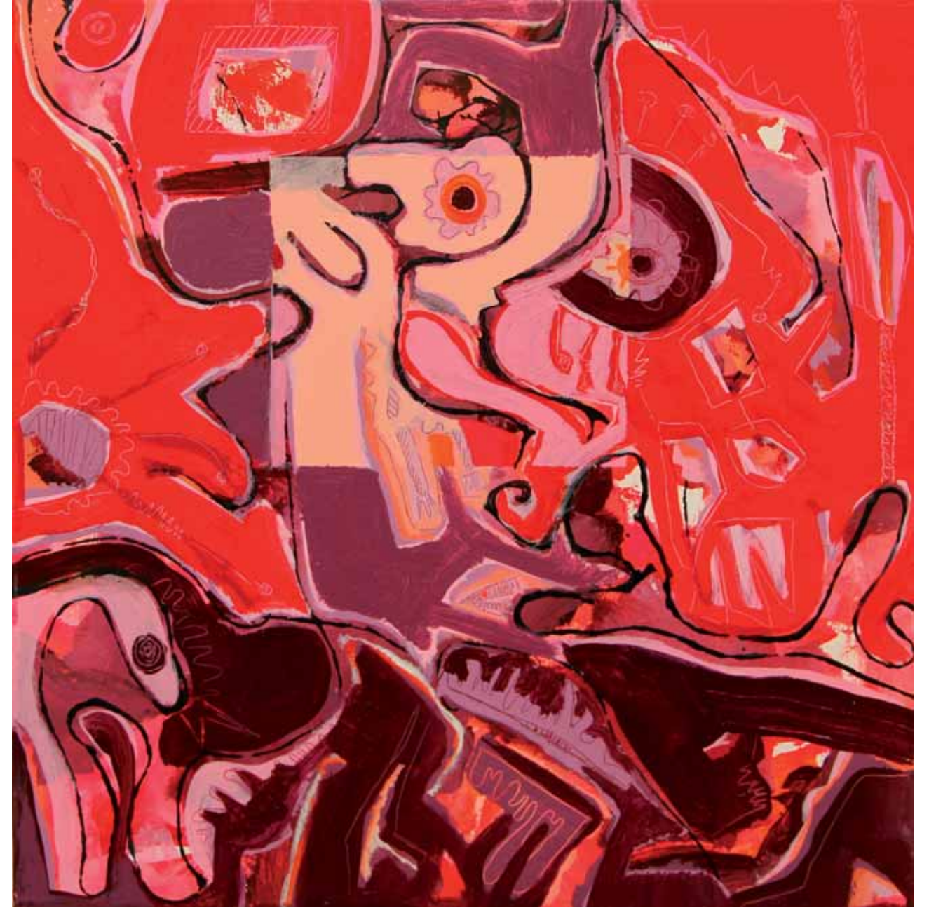
fragmentation d'un carré (Fragmentierung eines Vierecks) · Acryl auf Leinwand · 60 x 60 cm · 2010