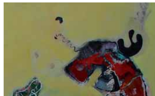
ma ligne maligne

3 Ausschnitte · Acryl auf Leinwand · 200 x 200 cm · 2009