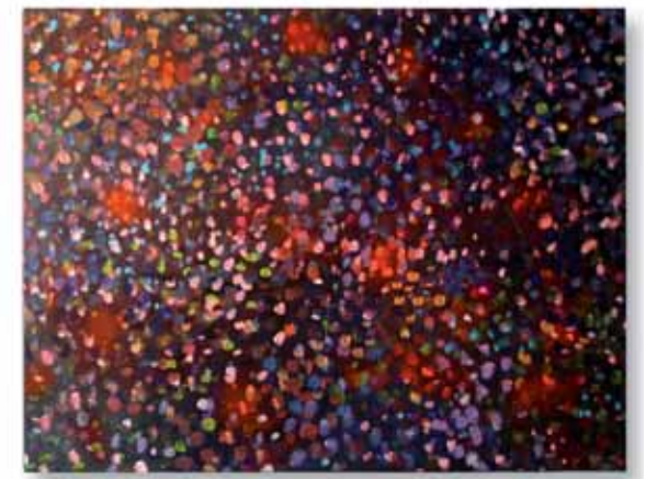
o. T. Diptychon · Acryl auf Leinwand · je 33 x 39 x 8 cm · 2000