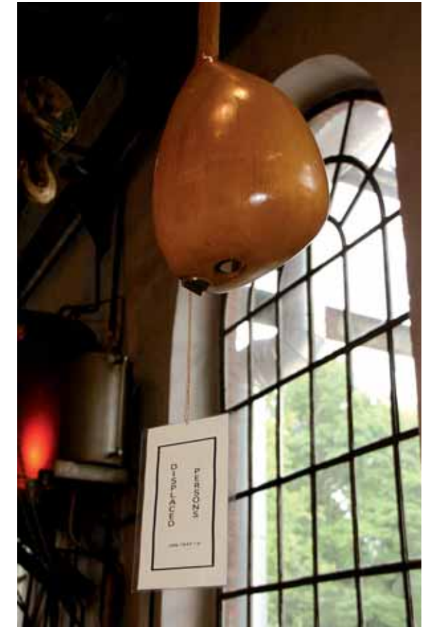
Instrument Installation · (Saz: Muammer Yalcin) · 2009