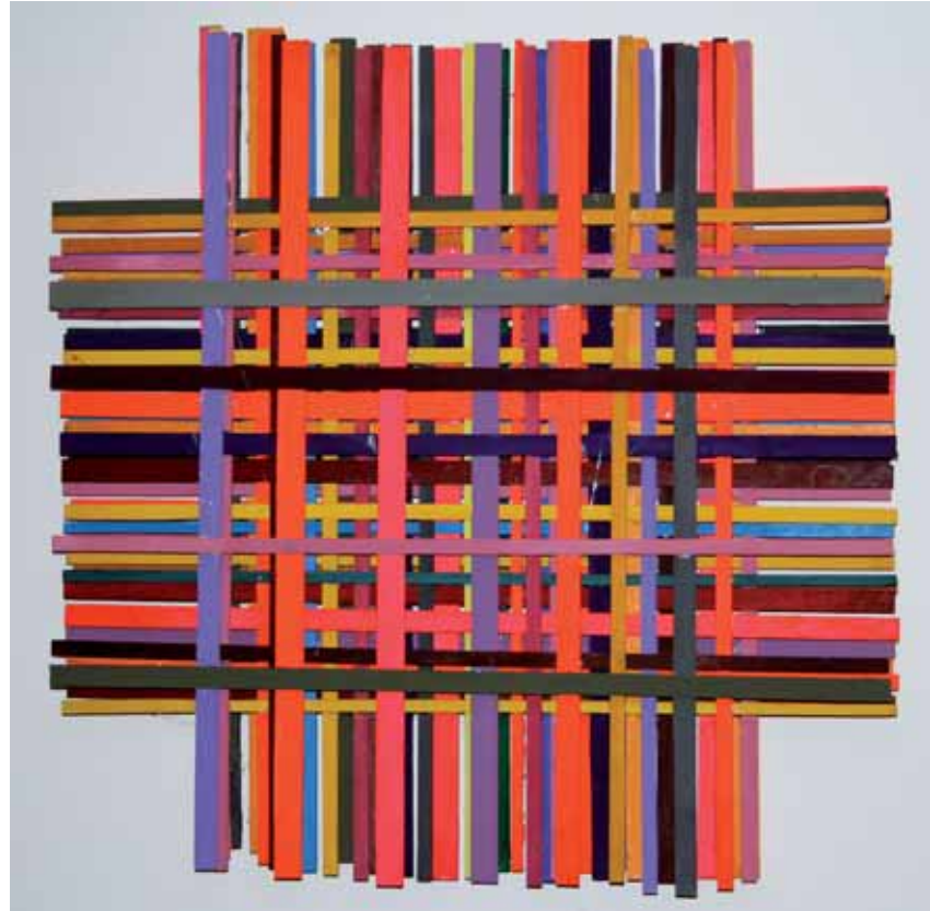
o. T. Holzobjekt - 60 x 60 cm - 2010