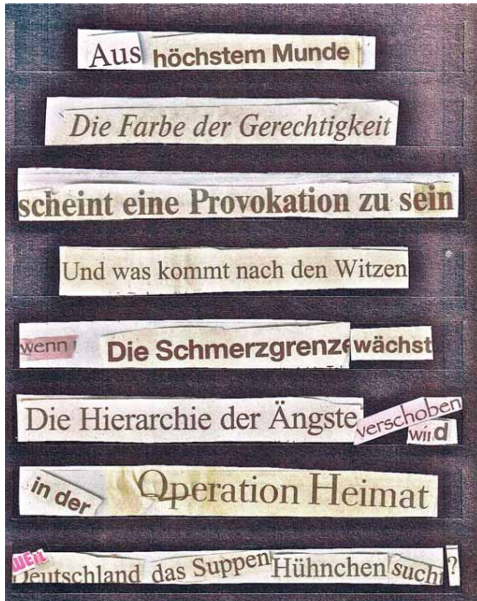
Operation Heimat Detail aus „Ausländer raus“-Video · Papier · 21 x 29,7 cm · 2009