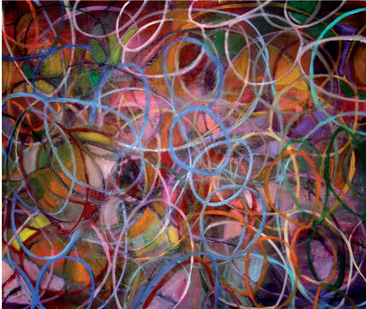
Rolling on Acryl auf Leinwand · 100 x 120 cm · 2010