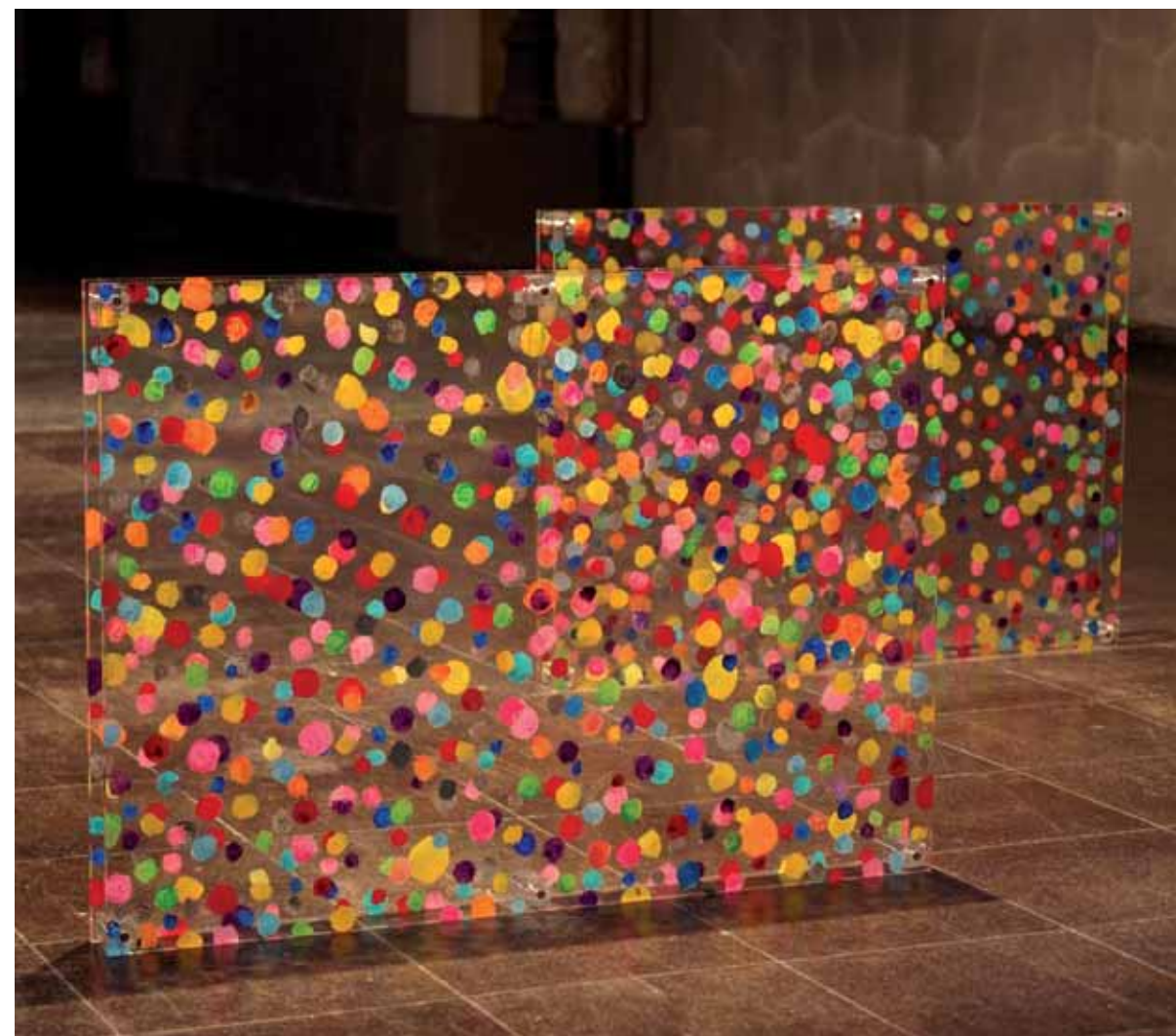
o. T. Acryl auf Plexiglas · je 50 x 69 cm · 2004