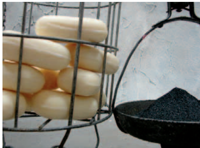
Drahtkorb, Seife, Kohlenstaub von André Schweers