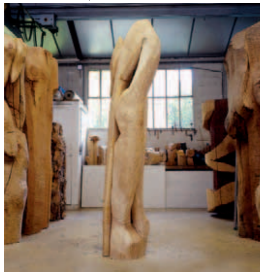
Couple réveur 4 von Hélène Gauthier